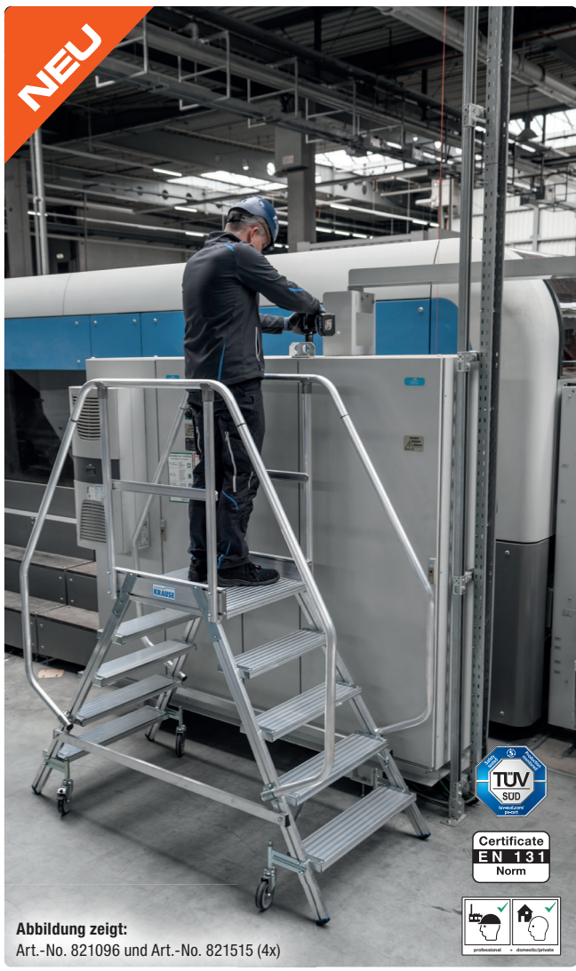
Abbildung zeigt: Art.-No. 821096 und Art.-No. 821515 (4x)